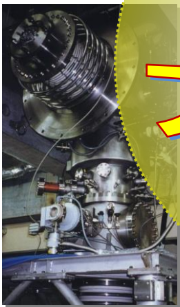
電通大のプラズマ実験装置