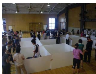
防災ボランティア