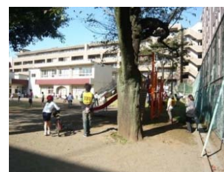
見守りボランティア