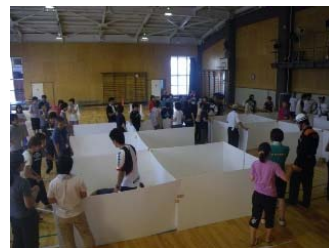
防災ボランティア 福祉避難所等の 設営を手伝う