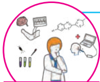
医療・バイオラボ

ユニークな動きをしたり特殊な操作をするなど様々なロボットの研究開発をご案内します。