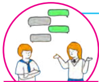
コミュニケーションラボ

モノを照らすだけでなく、計測や通信にも大活躍の光技術を使った新しい開発の現場をご案内します。