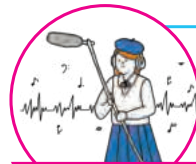
メディアアートラボ

言葉を交わす、他を認識する、相手の心を理解するなどコミュニケーションを実現する仕組みを探る研究をご案内します。